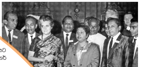
හිටපු ඉන්දීය අගමැතිහි ඉන්දිරා ගාන්ධි සමග

- ආචාර්ය ලෙස්ටර් ජේම්ස් පිරිස් 2006 වසරේදී