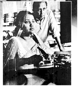
අය සංස්කරණය කළ සිනමාපට වෙනුවෙන් සම්මාන දිනා ගත්තාය.

ජූනි 17 වැනිදා සුම්‍රා ගුණවර්ධන සමගින් විවාහ විය. ලන්ඩන් ස්කූල් ඔෆ් ඊල්ම් ටෙක්නික් ආයතනයේ සිනමා නිෂ්පාදනය සහ අධ්‍යක්ෂණය පිළිබඳ ඉගෙන ගෙන තිබූ අය පසුව ලෙස්ටර්ගේ නිර්මාණ වෙත දායකත්වය ලබාදුණි.